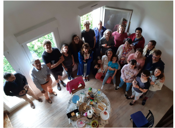
2 juillet 2023 Organisation d'un apéro - crémaillère