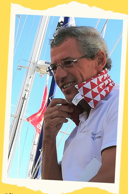
Sébastien Destremau , navigateur du Vendée globe et parrain de l'association